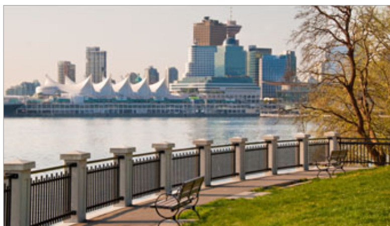
Outono em Vancouver

Você pode aperfeiçoar o seu inglês e ainda ganhar algum dinheiro para gastar enquanto conhece o país. É importante escolher um programa que possibilite o estágio