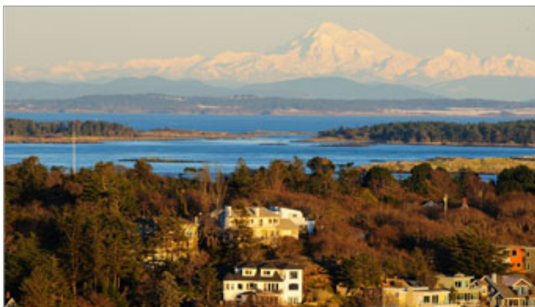
Cidade de Victoria

A civilização é um dos pontos fortes dos canadenses. Acostumados com as mais diversas culturas, são pessoas educadas e tolerantes