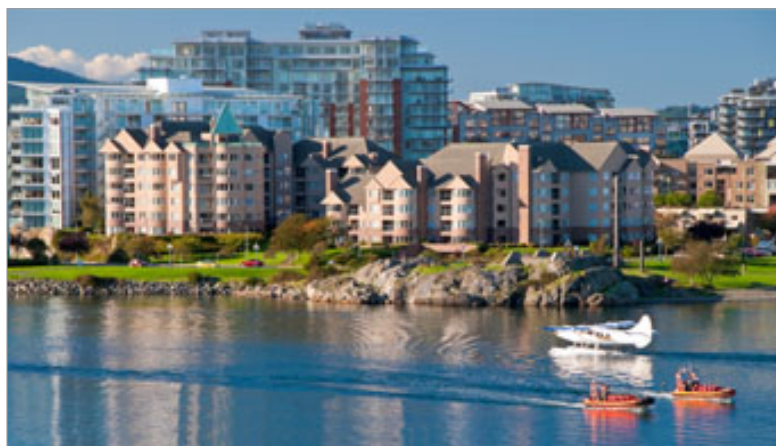
Vista das montanhas em Victoria

Veja algumas das principais vantagens de estudar Canadá. Intensa vida cultural, custo de vida baixo e modernidade e receptividade com estrangeiros são alguns exemplos