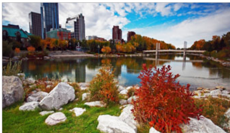
Cidade de Calgary no Canadá

As quatro estações do ano no Canadá são bem definidas. Entenda como é o clima no Canadá e se programe para ir ao país na época que mais te agrada e tem a ver com o seu estilo de vida