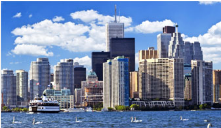
Cidade de Toronto

Veja as vantagens de aprender ou aperfeiçoar a língua inglesa estudando no Canadá