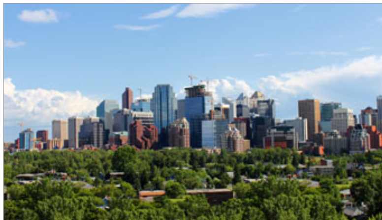
Vista aérea de Vancouver

Saiba como dar entrada no processo de visto para estudar no Canadá e garanta que sua entrada no país será permitida. O processo é simples e o visto não demora a ser concedido