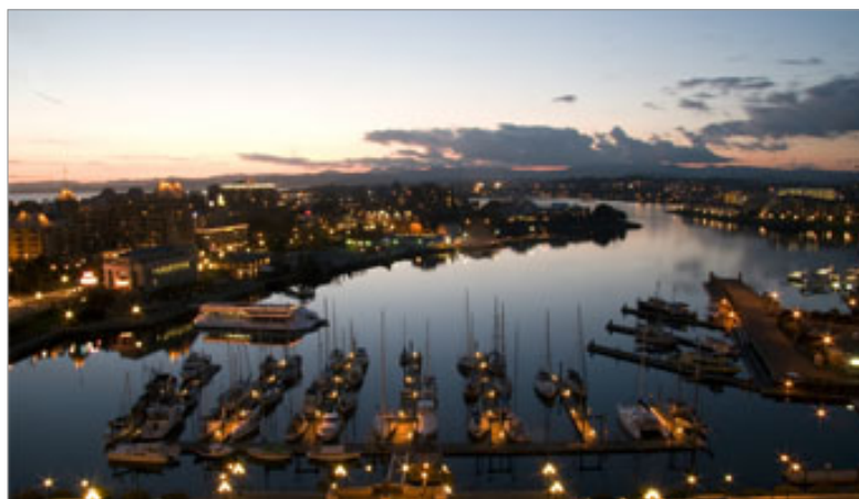
Victoria ao anoitecer

Veja dicas dadas pela vice-cônsul do Canadá, Heather Bystryk, para que seu intercâmbio seja um sucesso e todos os momentos, de aprendizado e diversão, sejam bem aproveitados