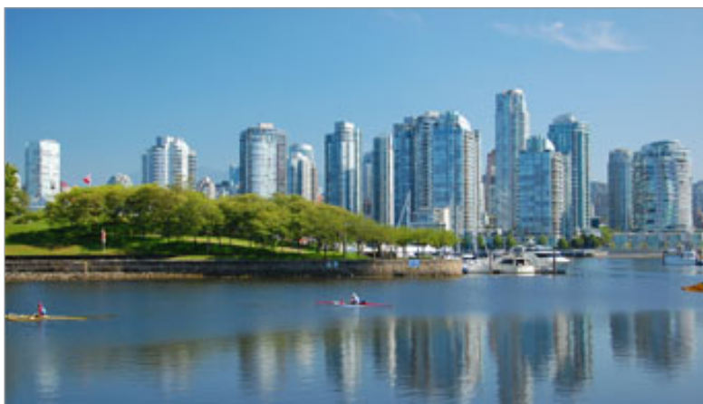
Rio na cidade de Calgary

Se você já escolheu uma cidade e um programa para o seu intercâmbio no Canadá, precisa ser aceito na instituição desejada pra começar a preparar sua viagem