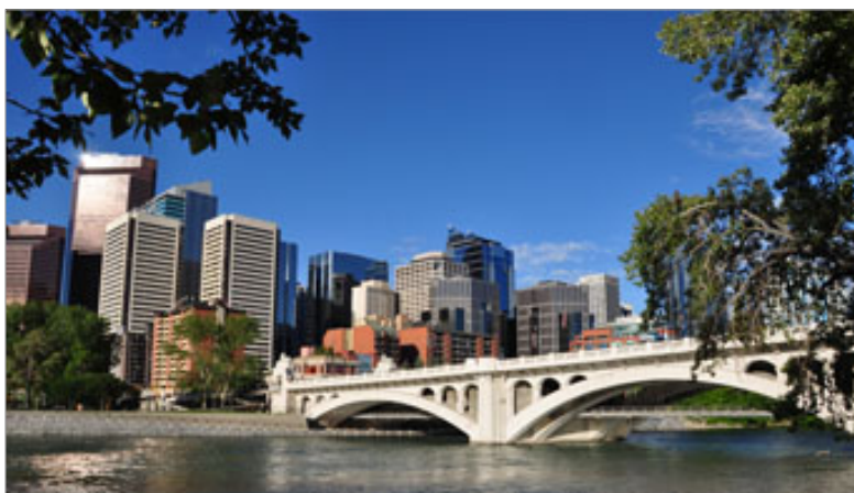
Ponte da cidade de Calgary

Os programas de inglês oferecidos pela Languages Canadá podem ser realizados em colégios ou universidades. Descubra onde você prefere fazer o seu