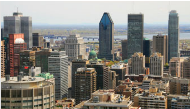
Prédios em Toronto

Veja por que o Canadá é um dos destinos mais procurados para fazer intercambio de inglês. Entenda quanto vai custar aprender o inglês de verdade