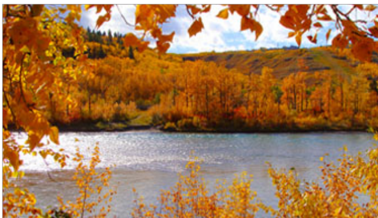
Vista dos lagos em Calgary

Veja os hábitos alimentares comuns no Canadá e já se prepare para não passar fome durante o intercâmbio. Mas não se preocupe, devem servir sua comida preferida por lá